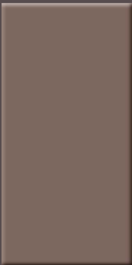
_Laccato opaco Terracotta Y23919