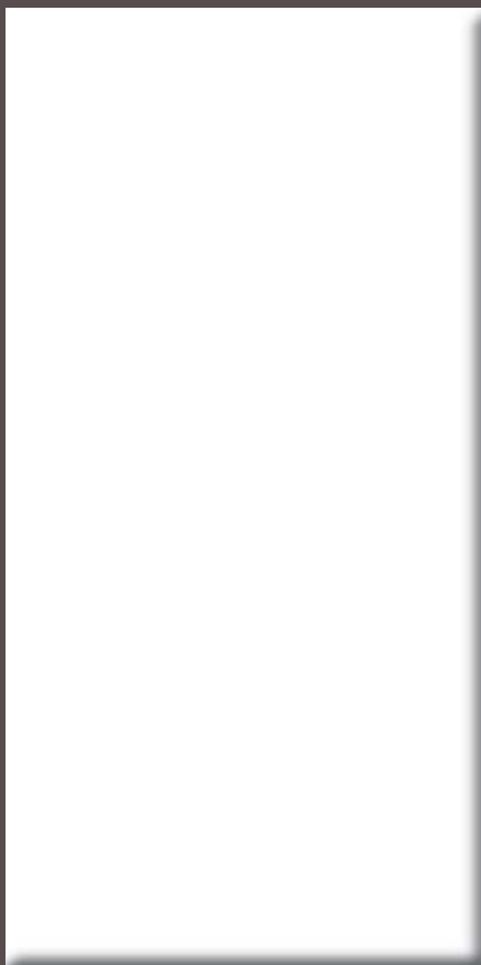
_Laccato opaco Bianco 050